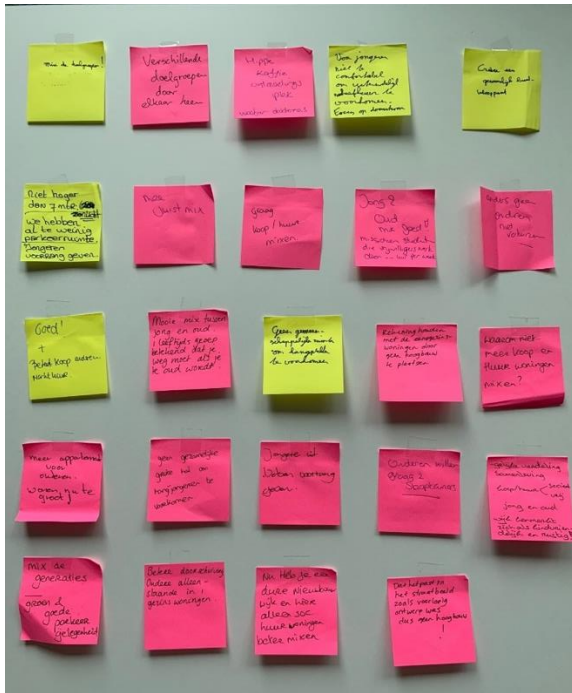
Bord 5: De uitstraling van de gebouwen